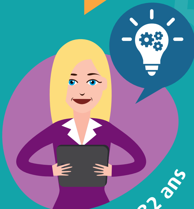
Clotilde 32 ans